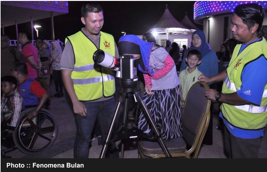
Photo :: Fenomena Bulan