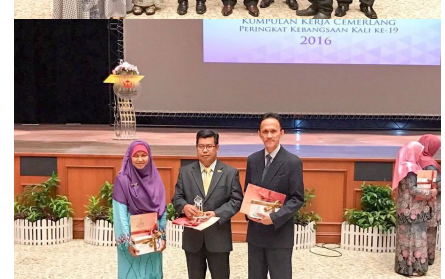
Photo :: KKC Peringkat Kebangsaan