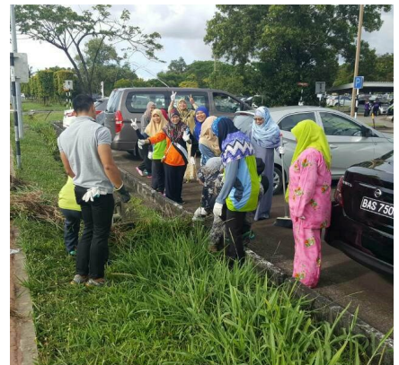
Photo :: UKUR Kempen Kebersihan