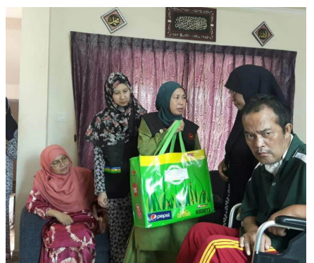
Photo :: Bantuan Amal